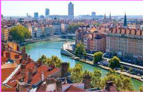
Events de convivialité à Lyon (Bars et restaurants)